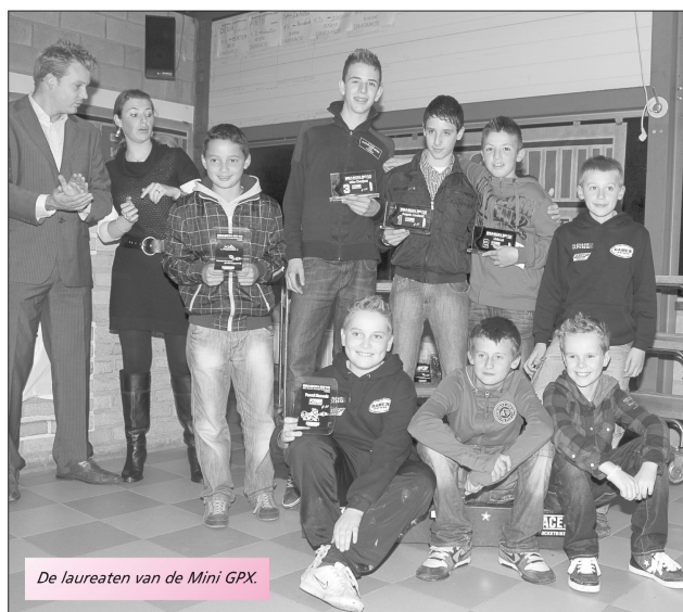
De laureaten van de Mini GPX.