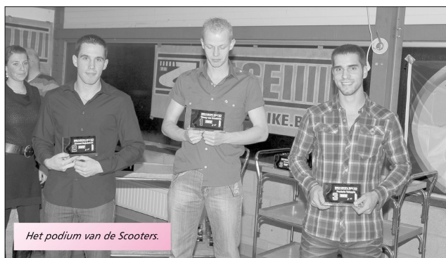
Het podium van de Scooters.