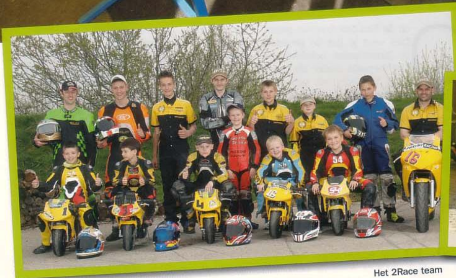
Het 2Race team