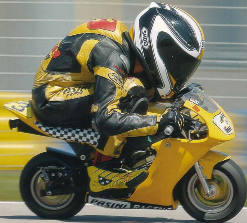
De windbescherming leek nergens op. (Lukas Tulovic)