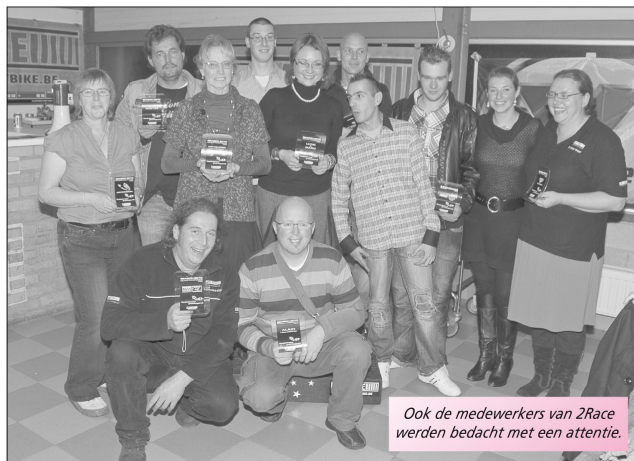
Ook de medewerkers van 2Race werden bedacht met een attentie.