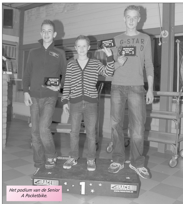
Het podium van de Senior A Pocketbike.