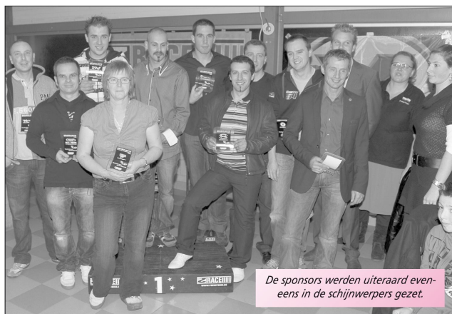
De sponsors werden uiteraard eveneens in de schijnwerpers gezet.