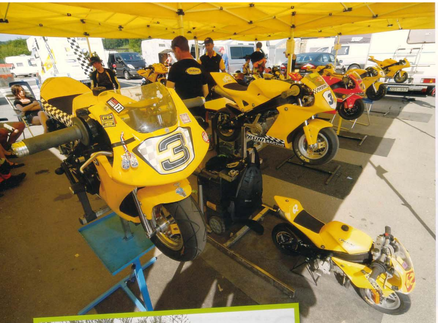
De tent van Verhoeven