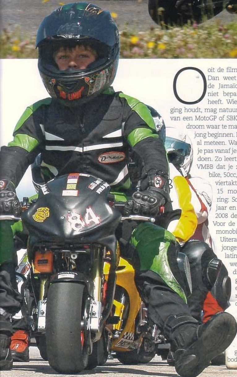
Laat me door of ik roep m'n papa.

O it de film Cool Runnings gezien? Dan weet je dat de gemiddelde Jamaicaanse bobsleeër het niet bepaald onder de markt heeft. Wie echt van een uitdaging houdt, mag natuurlijk ook altijd dromen van een MotoGP of SBK-loopbaan. En om een droom waar te maken, kun je maar beter jong beginnen. Daar knelt de racelaars al meteen. Want in Vlaanderen mag je pas vanaf je vijftien aan competitie doen. Zo leert het reglement van de VMBB dat je zowel voor de pocketbike, 50cc, automaten minimoto viertakt en 125cc minstens 15 moet zijn. Ter herinnering: Scotteke Redding was 15 jaar en 170 dagen toen hij in 2008 de Britse GP 125cc won. Voor de Belgian Supersport of monobike moet je zelfs 16 zijn. Uiteraard moet iedereen die jonger is dan 18 ook de toelating van ouders (of hun wettelijke vertegenwoordigers) kunnen voorleggen. Vooral eer je dan echt op circuit mag racen, ben je verplicht om deel te nemen aan een vormingssessie. Hierbij komt zowel de theorie (procedures in verband met start, vlaggen, stop & go) als de praktijk aan bod. Gezien de beperkte motorsportcultuur in ons land ziet het er